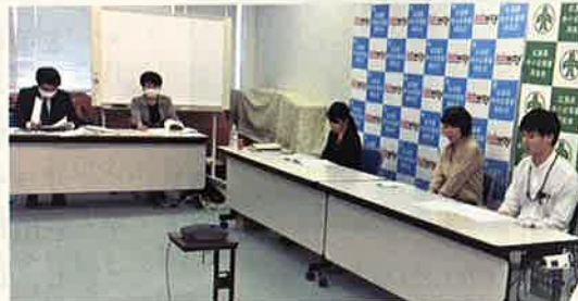
10/28 新入社員モチベーションアップ研修@Zoom 配信会場の様子