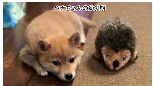
ハナちゃんの幼少期