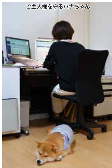
ご主人様を守るハナちゃん