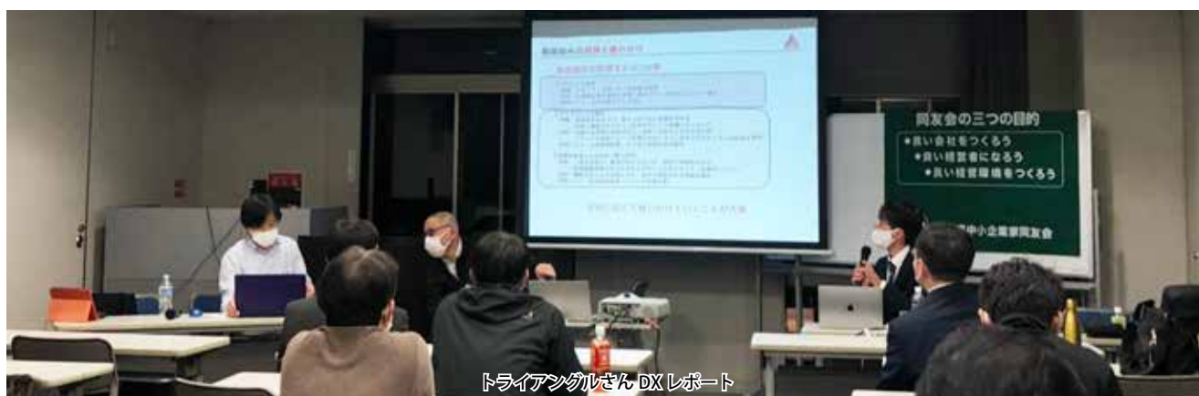
トライアングルさん DXレポート