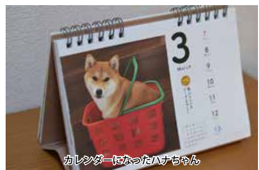
カレンダーになったハナちゃん