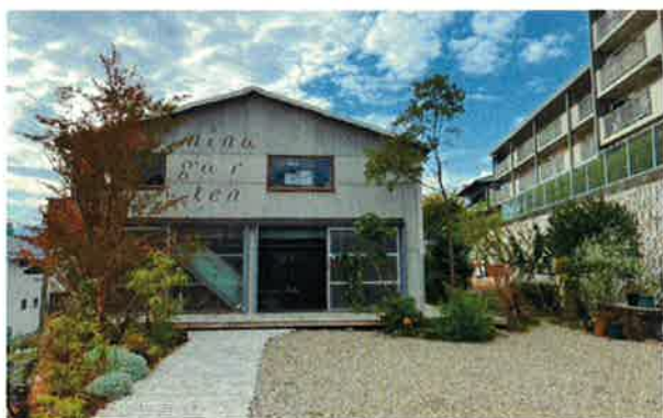
11月から新たな拠点となったミナガルテン（佐伯区皆賀）

今年 11 月からは、新たな拠点として、広島市佐伯区皆賀にあるミナガルテン内のシェアサロン「salon elan vital (エランビタール)」でも、曜日限定で活動を始めておられます。