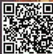
最新情報はこちら

【シャンプーと小顔@ミナガルテン】 〒731-5124 広島市佐伯区皆賀3-8-11 minagarten[ミナガルテン]内 営業日 水・金・土・日10:00~18:00