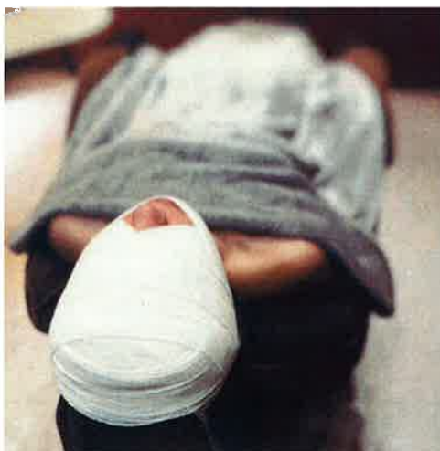
毎回眠ってしまうほど気持ちのいい施術は評判！

もっとヘッドスパを身近なものに感じていただき、疲れを癒しながら、頭皮環境の改善や美髪へと導く施術を提供したいという想いを込めて、屋号に「シャンプー」も入れたそうです。女性だけでなく、男性も利用可能なのは、嬉しいところですね。