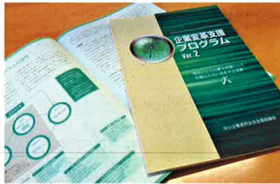
企業変革支援プログラム ver2 が完成しました