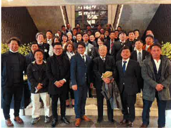
大いに盛り上がりました

12月例会は、恒例の青年部OBを交えた忘年会を開催しました。本格的なコロナ対応が始まって3シーズン目の忘年会。当然ながら適切な対策を講じつつではありましたが、年末に顔を突き合わせ杯を重ねての親交を深められる事のありがたみを実感いたしました。懇親会半ばでは、令和3年度1月～3月入会及び令和4年度入会の