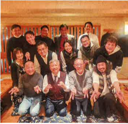
炭焼鳥長にて記念撮影

二〇二二年は3月後半から6月にかけて3か月上海がロックダウンをしました。私はその間浙江省舟