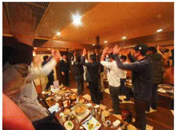
来年も良い年を迎えることを祈って万歳！

新体制が始まってあつという間に年末を迎えました。皆さんの人との出会いと新しい役割に奔走した一年でした。