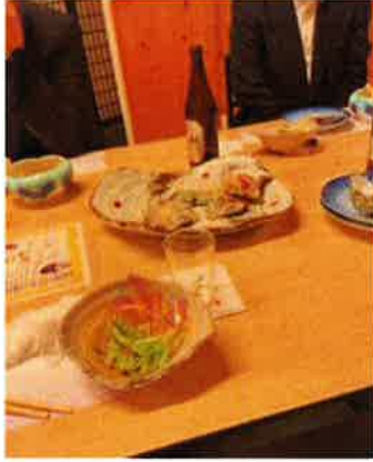
美味しい牡蠣をいただきました

さる12月15日、芸南地区会の12月例会が開催されました。参加者は18名で、コロナが落ち着いたこともあり、リアルで開催しました。今回は忘年会ということで藤田屋で盛大に開催されました。いつものように時間が足らず、思い思いのことを3分以内で語り、時間オーバーで終了致しました。