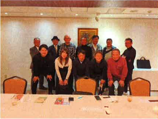
これからの目標を語り合いました

今月は昭和地区会の忘年例会がクレイトンベイホテルにて開催されました。参加人数は13名、昭和地区会員から8名、呉南地区会員から3名、オプザーバーから2名の参加で開催されました。今回は昭和地区会員8名の参加があり、直接電話連絡を取らせて