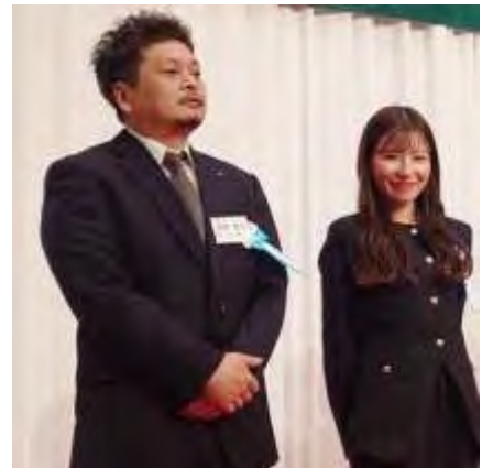
新会員紹介の様子