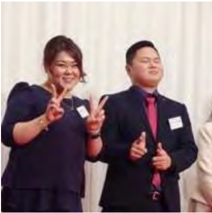
福男・福女紹介の様子