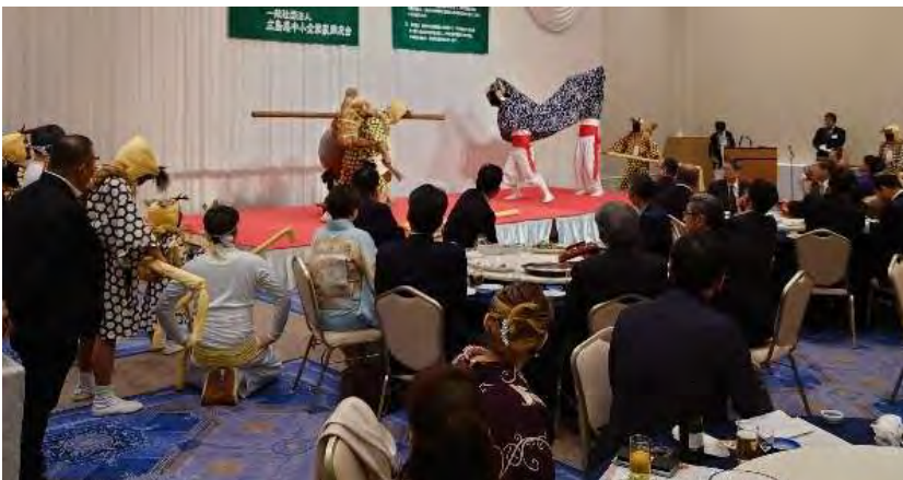
やぶと獅子舞の演舞の様子