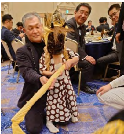
野上企画委員と「子やぶ」