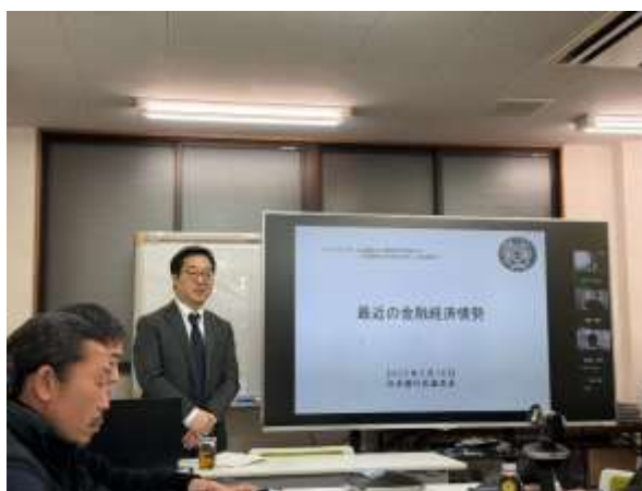
様々なデータをご提供頂きました

対応について、熱い質疑がなされました。懇親会においても、世界や日本の情勢を踏まえて、我々がどう対応していくべきなのか、議論が進みました。