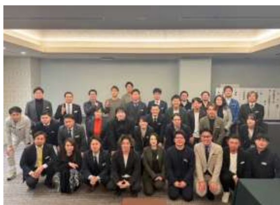
参加者全員で記念写真

職場で働く従業員の方、お客様、友人、家族、自分等、周りの関わる方を笑顔にしたいという様な意見もあり再度笑顔について考えさせ