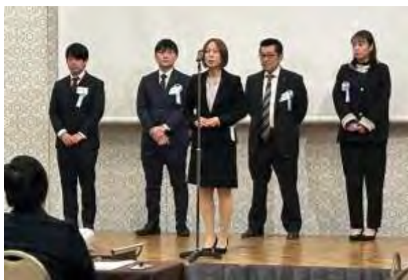
新会員の皆さんによる自己紹介の様子

介・決意表明ですが、緊張の中にも確固たる経営に対する姿勢を感じ取ることができました。 その後の懇親会も、積極的な名刺交換や交流が進んでいました。