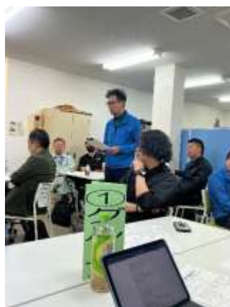
グループ発表の様子

広報委員会は、毎月第2火曜日19時に事務局にて開催しております。運営だけでなく、広報の悩みを持ち寄って、学べる委員会を目指しております。広報委員以外の方の参加もお待ちしております。