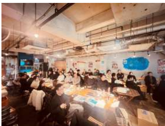
いつもと違う熱気がありました

今回、参加者が多く、グループ討論は今回ありませんでしたが、飲食をしながら、懇親を深めながら真面目に楽しく語り合う、会員満足度調査で最も要望の声が多かった例会が正にこんなイメージなんだろうな...!と思いつながり楽しく過ごしました。