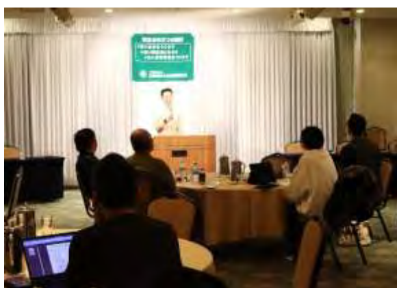
開会挨拶の中里支部長