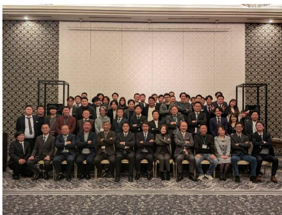
「呉森沢ホテル」にて恒例の記念写

「経営者同士の交流こそが最大の学びである」と感じました。交流の中で得た気づきや刺激を自社へ持ち帰り、行動につなげていくことが、同友会運動、そして青年部会での行動の第一歩であると再認識できた例会でした。ご参加・ご協力いただいた皆様に心より感謝申し上げます。良いお年をお迎えください。