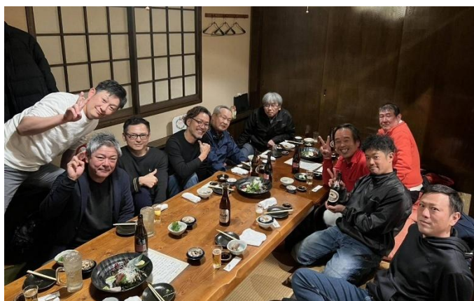
「うま味」を感じられる一年にするぞ！