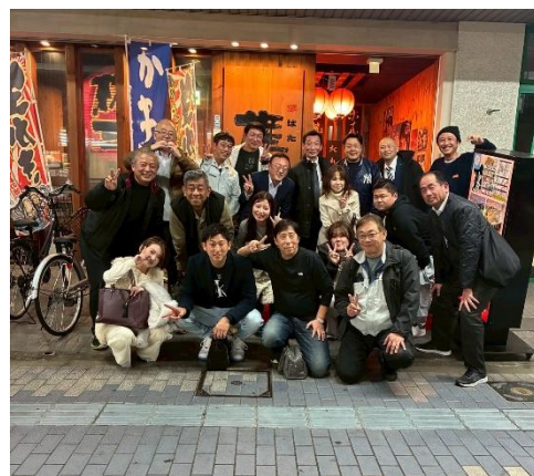
「権三」前にて恒例の記念写真

わいわいと語り合い、年代も、業種も超えて、課題を共有し今回も忘年会は貴重な機会となりました。