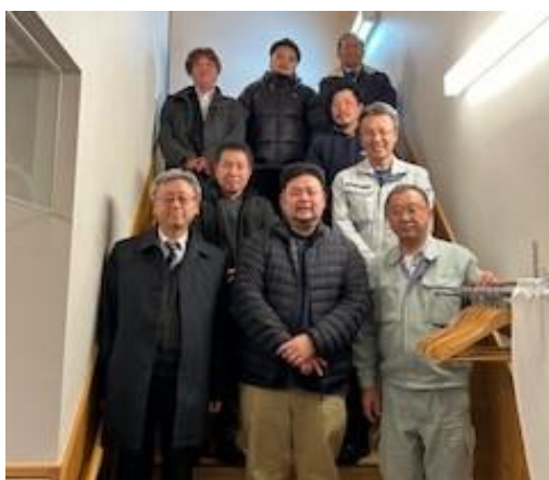
「藤田屋」にて恒例の記念写真

また、年明けには新年互礼会、2月例会、3月例会と活動は続きます。今年度を駆け抜けるべく、役員一同邁進していきます。