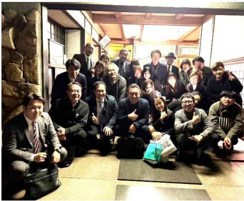
「戸田本店」にて恒例の記念写真

楽しい時間はあっという間に過ぎ、名残惜しさを感じつつもお開きとなりました。今回は勉強を少しお休みし、心とお腹を満たす例会となり、ゆったりとした気持ちで来年への英気を養うことができました。