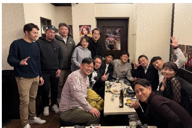
広東メンバーと一緒に良い年を過ごすぞ！

した。いつもありがとうございます。皆さま、来年も引き続きどうぞよろしく願いいたします。